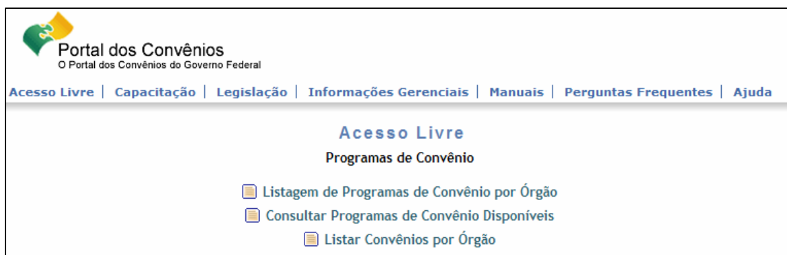
Figura 2: Acesso livre do Portal dos Convênios

Tendo em mente que o Brasil não possui forte tradição de controle social das ações de governo, para fomentar participação popular, por menor que seja, os órgãos e entidades governamentais deveriam facilitar acesso aos dados e informações geradas pela administração pública, provendo interface simples e intuitiva, e envidando esforços para transformar o linguajar tecnicista, próprio do setor público, em linguagem compreensível inclusive ao considerado cidadão comum.