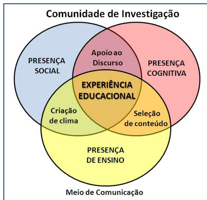
Figura 2 – Comunidade de investigação.

O modelo Comunidade de Investigação, esquematizado na Figura 2, pressupõe a participação de alunos e professores e é constituído de três componentes principais: Presença Cognitiva, Presença Social e Presença de Ensino. Esses componentes foram divididos em categorias como unidades de análise. No Quadro 2 são apresentados os componentes, categorias e indicadores propostos por Garrison et al. (2000).