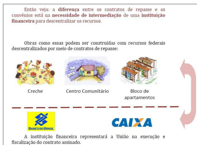
Figura 5 – Exemplo de uso de imagem no curso.

A linguagem do conteúdo e das orientações parece adequada, uma vez que o tema convênio é tratado geralmente com citações de leis e normas, que poderia gerar dificuldades para alunos que não fossem iniciados em interpretações de legislação e linguagem jurídica. Houve preocupação em usar imagens para ilustrar as informações apresentadas e usar símbolos para chamar a atenção dos alunos em aspectos considerados relevantes na leitura. Exemplificando, a Figura 5 apresenta a relação entre as instituições financeiras governamentais e exemplo de obras que são possíveis de serem realizadas por meio de contrato de repasse. A Figura 6 apresenta um sinal de alerta como símbolo para chamar atenção sobre uma restrição muito importante para uso de contrato de repasse.